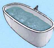
Baignoire 120 à 150 litres