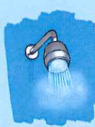
Douche 20 à 60 litres