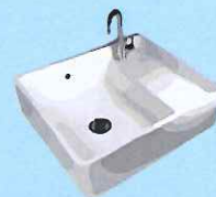
Evier 10 litres